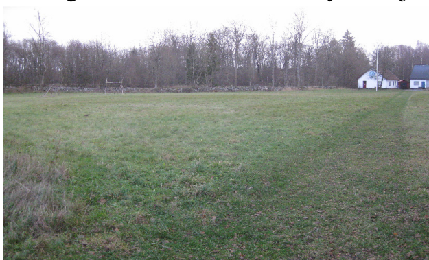
Samlingsplass / programområde

Noen glimt i fra området ved Gyllebosjøen, med blanding av jorder og åpen skog: